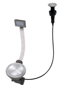
Automatischer Abfluss Space Push - PP 8407 116