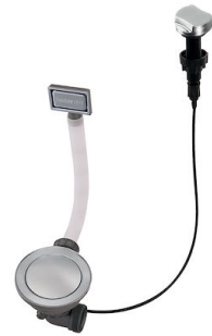
Automatischer Abfluss Space - PE 8407 109