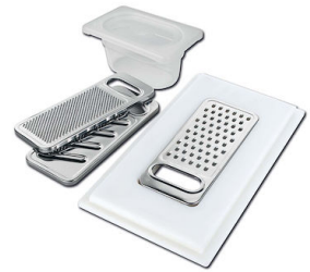
Satz Reibe mit Halterung für Ring und Auffangschale