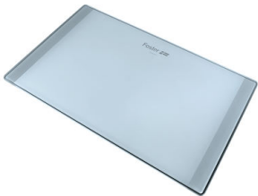
Schneidebrett aus Glas 8633 300

* nur in Kombination mit dem Zubehör 8644 101