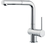
Mischbatterie Gamma 8483 001