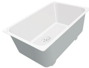
Weißer Wanne 8153 100

* nur in Kombination mit dem Zubehör 8644 101